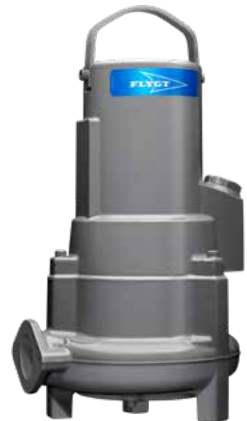
De Flygt NP3069 drukrioleringspomp.