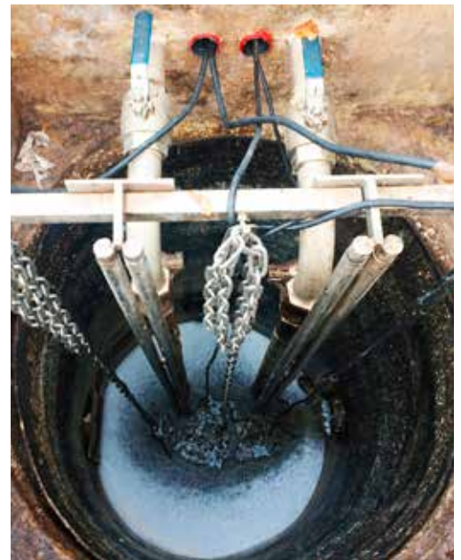
Het minigemaal in Boskoop

Capaciteitsprobleem opgelost zónder noodzaak het gemaal te verzwaren